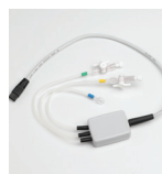
Manomètre 1, 2 ou 3 voies